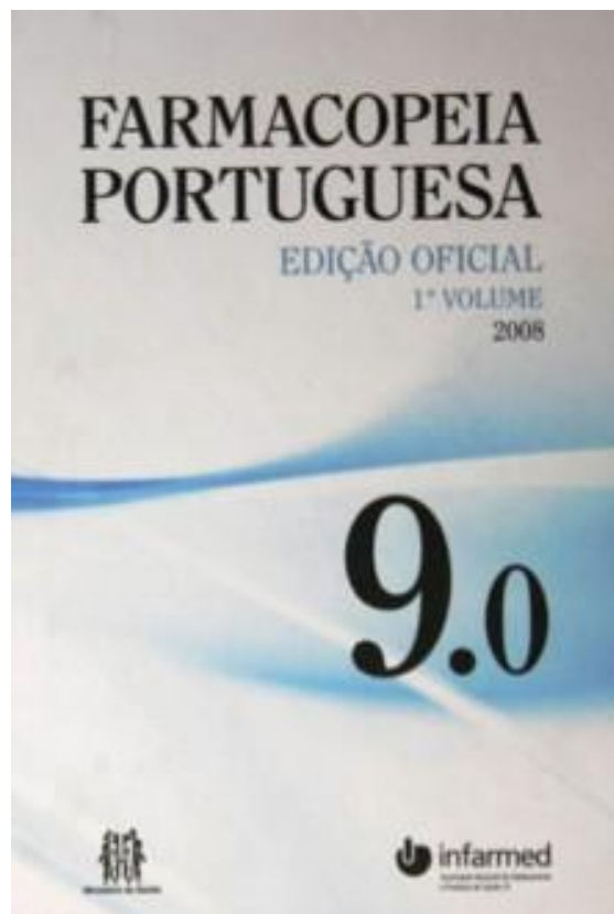
Figura 2. Frontispício da Farmacopeia Portuguesa 9.0 , 2008 48

Relativamente à frequência de atualização, a Ph. Eur. tem nova edição a cada três anos, com