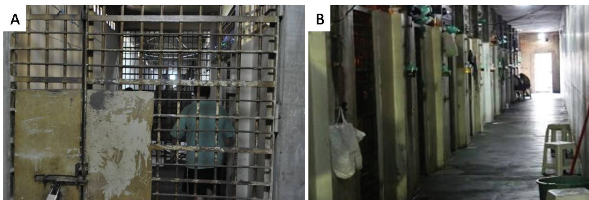
Figura 1. A. Entrada para um dos corredores dos detidos separada por grades de segurança. B. Um dos corredores do setor prisional com suas respectivas celas.

A pesquisa foi realizada em duas etapas. A primeira serviu como triagem e caracterização dos detidos e foi realizada pela aplicação de um questionário (Anexo 1) dentro do próprio setor prisional. Na segunda etapa, os internos que preencheram corretamente o questionário, foram convidados a realizar os testes sanguíneos para detecção do HCV. A coleta de sangue foi realizada nas dependências do ambulatório da 14 o SDP. Foi utilizado o teste rápido para HCV da WAMA Diagnóstica® (São Carlos, Brasil), que utiliza a tecnologia imunocromatográfica de fluxo lateral, a qual detecta de forma qualitativa o anticorpo anti HCV presente na amostra (Figura 2). Portanto, este teste é considerado marcador sorológico a ser detectado tanto na fase aguda quanto na crônica, não diferenciadoras 19 . Toda coleta e análise seguiu o manual do fabricante 20 . Os resultados